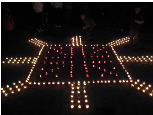
Het patroon met lichtjes werd steeds groter