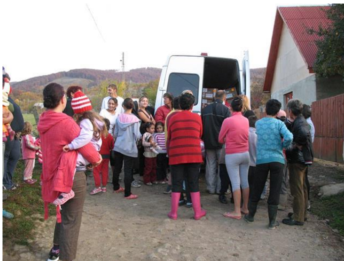
Er wordt rustig gewacht tot men aan de beurt is

Op deze manier weten wij zeker dat de voedselbonnen op de juiste manier gebruikt worden. Er mag absoluut geen drank of tabak met de voedselbonnen gekocht worden !!