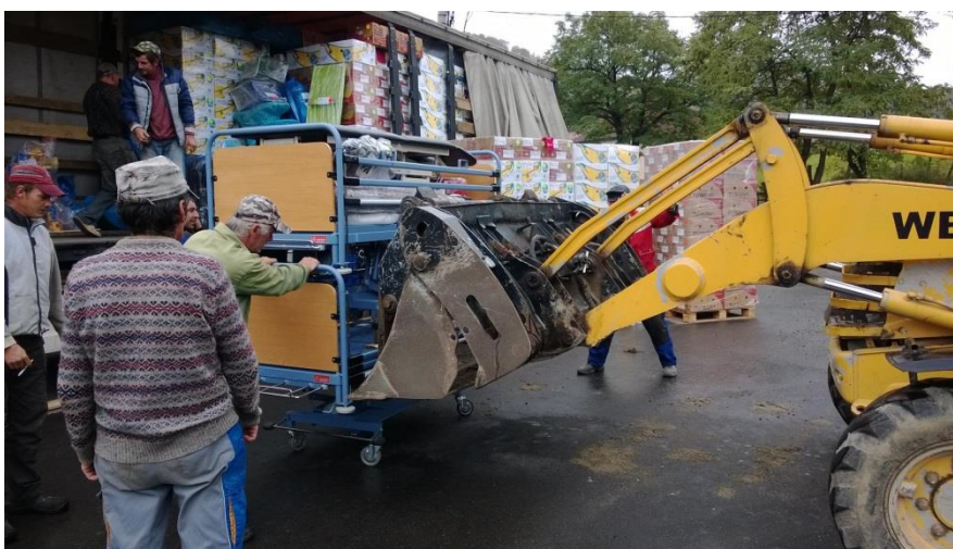
Het lossen van de ziekenhuisbedden met een graafmachine en veel mankracht

gedaan om hulp te bieden bij het lossen van de truck en stelden daarbij een graafmachine en een boerenkar ter beschikking.