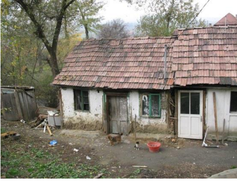
Huisjes op de Morii

Wij zullen de school waar de kinderen naar toe kunnen, berichten dat deze kinderen ingeschreven moeten worden en het leerprogramma moeten volgen. Moeder probeert iedere dag ergens werk te vinden of gaat bedelen, terwijl oma dan op de kinderen past. Niet iedere dag is er eten voor iedereen en zij moeten soms een stukje brood met z'n achten delen. In het krotje is geen water of elektriciteit.