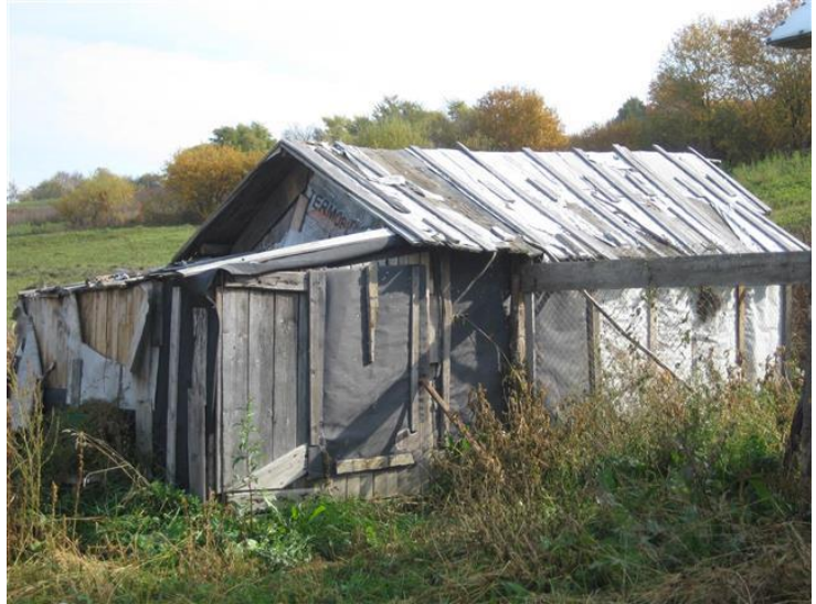
Huisje op Sarateni, zelfs als schuur voor dieren niet geschikt