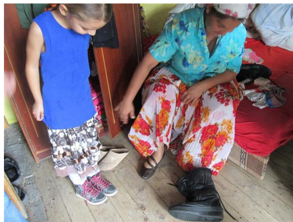
Voor moeder en dochter nieuwe schoenen en laarzen die perfect passen

Geweldig en wij vinden het heel bijzonder dat wij deze zomaar hebben gekregen !!!