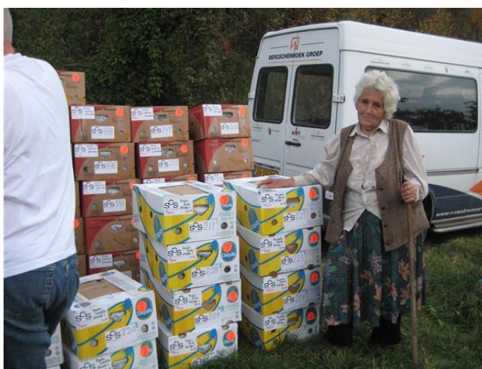
Trots met de dozen die er voor de groep op de Minei zijn

Dat is fijn om te horen en iedereen lijkt er tevreden mee te zijn.