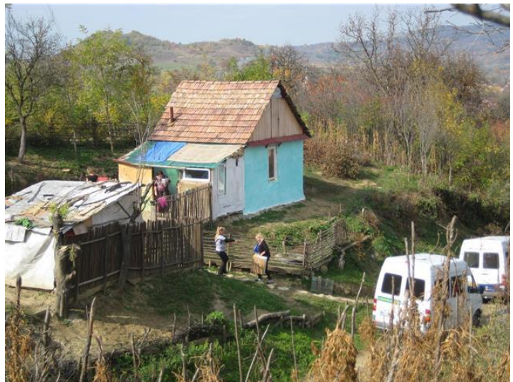
In het groene huisje wonen Zita en Ionel met 8 kinderen

Zij gluurt in de bus en begint te lachen als zij een verpakte kinderwagen ziet staan en vraagt stralend of deze voor haar is. Natuurlijk is die voor haar en Jan, Janny en Cees pakken de kinderwagen uit de auto en zetten de wagen in elkaar.