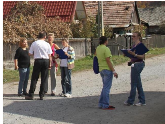
Tussendoor even teamoverleg

Op de scholen is géén seksuele voorlichting en binnen de gezinnen wordt daar niet over gesproken. SOS is daarom ook dringend op zoek naar materialen voor de scholen waarmee seksuele voorlichting gegeven kan worden en wellicht zwangerschappen bij jonge meisjes daarmee kan voorkomen.