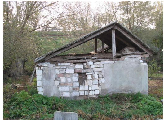
Eén van de huisjes op de Capeti

Wij missen een jongen uit een gezin en vragen waar hij is. Hij bleek in juli te zijn overleden aan een allergische reactie door bijensteken. Hij was in zijn mond en in het gezicht gestoken en zwol binnen 5 minuten zo op dat de jongen is gestikt. Een simpel medicijn had hem kunnen redden.