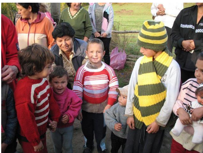
Blij met hun nieuwe gebreide truien, sjaals en mutsen

Het bedrag van een voedselbon bedraagt 5 euro en daar kunnen twee mensen ongeveer een week van eten. Maaltijden zonder vlees !!!