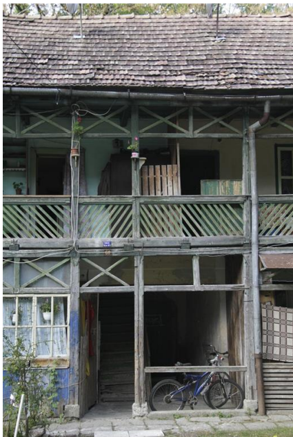
Entree van Trandafirilor gebouw

Sinds die tijd is er niets voor de bewoners gedaan om een toiletruimte voor de mensen te maken. De mensen moeten het maar uitzoeken en nu is het een grote beestenboel geworden achter het gebouw. Dat is natuurlijk niet zo gek als je weet dat veel mensen daar hun behoeften moeten doen. Sommige mensen hebben van oud hout een soort buitentoilet gemaakt, maar ook dat is een erbarmelijke en onhoudbare situatie.