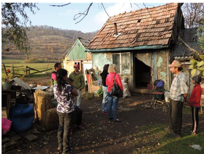
Kijken wat wij kunnen doen om de woonsituatie te verbeteren voor de winter aanbreekt

De gezinsdozen en de voedselbonnen worden blij ontvangen maar toch blijven de mensen vragen om extra voedsel voor de winterperiode. Er blijkt ook in deze wijk gewoon honger te zijn en niet alleen bij de ouderen.