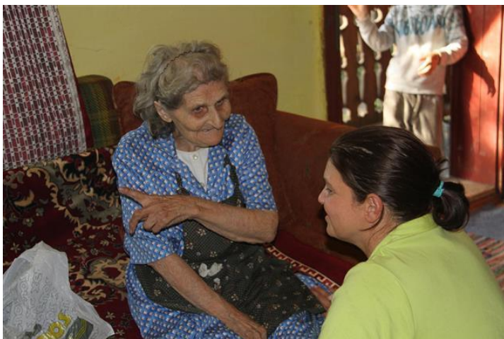
Blij met het bezoek en de tijd om even een praatje te maken

Ook Caritas, de thuiszorg organisatie, kunnen wij verblijden met ons bezoek en worden de nodige dozen en losse bundels achtergelaten. Natuurlijk is ook gesproken over patiënten die hard hulp nodig hebben en waaruit deze hulp zou moeten bestaan. Drie van