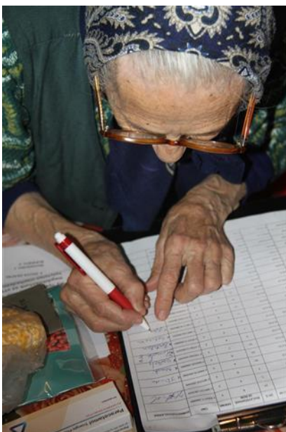
Tekenen voor ontvangst van de voedselbonnen.

Gelukkig gaat het met de meeste gezinnen goed en zien wij een langzaam groeiende vooruitgang.