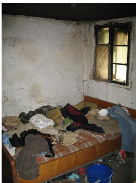
Ook van binnen is het niets bijzonders

Het krotje is zo rot als een mispel en de wind waait aan alle kanten naar binnen en als het regent, regent het binnen net zo hard als buiten.