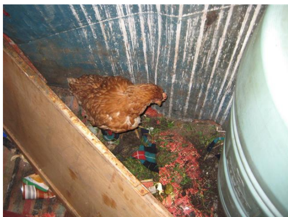
Kostbare kip in een hoekje van het hutje

De volgende wijk die wij bezoeken is de Praidului. Wij kregen ter plaatse een nieuwe aanvraag voor hulp en wij treffen een gezin aan met 4 kleine kinderen, die amper het hoofd boven water kunnen houden. De vader is houtlader en doet daarnaast nog allerlei klussen in de buurt. Het geld dat hij verdient met 12 uur per dag werken is niet genoeg om de huur van het huisje en het onderhoud van zijn gezin te betalen.