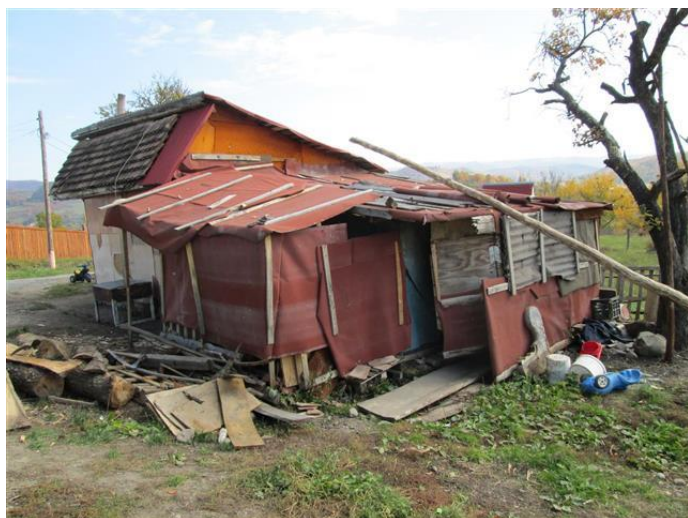
Eén van de huisjes op de Primaverii

Als zij de bus zien aankomen, springen zij werkelijk met twee voeten van de grond van