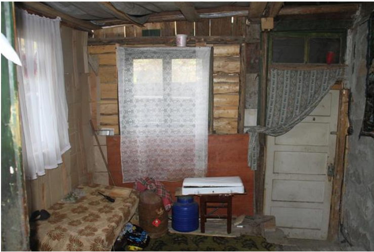
Bij de meeste houten huisjes kijk je tussen de planken door naar buiten. In de winter krijg je deze ruimte niet warm gestookt.