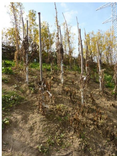
Veld met dode groentepplanten

Jammer dat door de nachtvorst veel groenten en planten kapot zijn gevoren en de