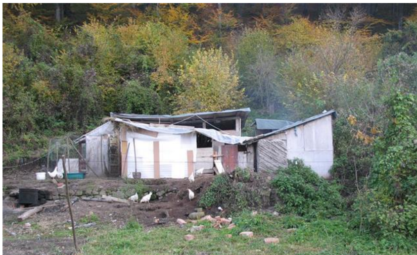
Ook op de Minei zijn de huisjes van zeer slechte kwaliteit

In de jaren dat wij daar hulp hebben kunnen bieden, zijn de mensen op het terrein naast de vuilnisbelt gaan wonen.