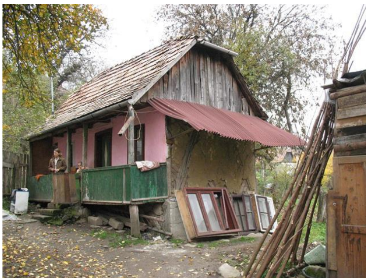
Zo lijkt het huisje nog wat, maar het is zo rot als een mispel

Voor het andere gezin met drie kleine kindjes hebben wij een dubbele kinderwandelwagen meegenomen en wij konden deze mensen niet blijer maken dan met deze wandelwagen. Natuurlijk zijn hier ook de persoonlijke gezinsdozen gebracht en voedselbonnen.