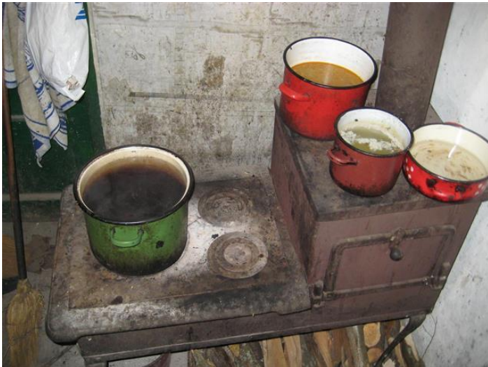
Eten wat al veel te lang staat

Het is al tegen acht uur s-avonds als wij een hapje gaan eten, de dag door nemen en de werkzaamheden voor de volgende dag gaan bespreken.