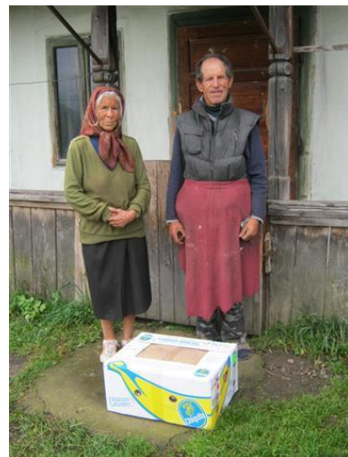
Trots met gezinsdoos en voedselbonnen

Dinsdag, de derde dag, begint met een bezoek aan het kleine ziekenhuis van Sovata. Voor het nieuw aangebouwde gedeelte van het ziekenhuis hebben wij prachtige, elektrisch verstelbare ziekenhuisbedden gekregen van een verzorgingshuis in Oud Beijerland. Wát een feest om deze prachtige bedden te mogen brengen bij het ziekenhuis. Dokter Irma straalde bij het zien van het aantal bedden en de prachtige kwaliteit van de bedden. De bedden zijn geplaatst in de beneden hal van het ziekenhuis en later zullen de bedden met behulp van de mannen van de Gemeente op hun plaats worden gezet op de begane grond en op de 1 ste etage.