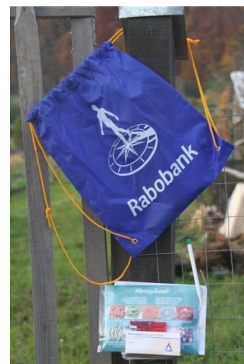
Tasje met zaden en paracetamol