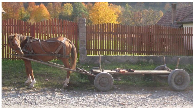
Dit magere paard rust uit na het bezorgen van een lading stookhout

Op zaterdag komen wij laat in de middag aan in een zon overgoten Sovata. De thermometer laat 25 graden zien en wij voelen ons echte bofkonten. Het lijkt erop dat het iedere keer mooi weer is als wij ons werk in Sovata komen doen. In Nederland was het daar in tegen slecht weer met heel veel regen.