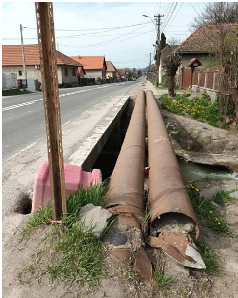
Een openbare weg zonder voetpaden. Levensgevaarlijk