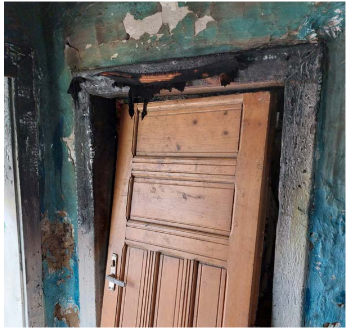
Een verdrietige Geza