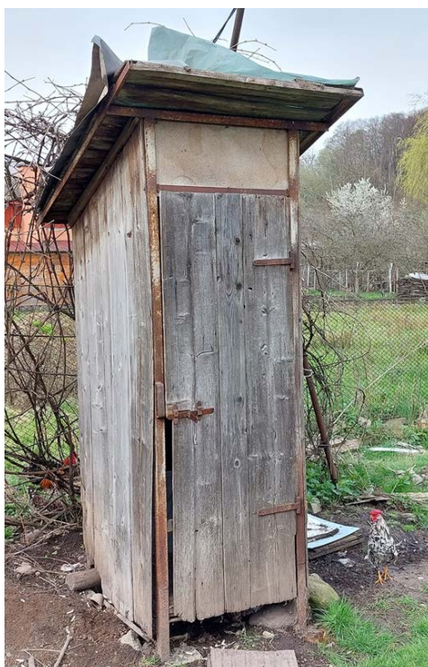
Een van de toiletten