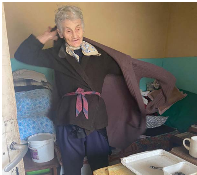
Huis op de Campul Mic