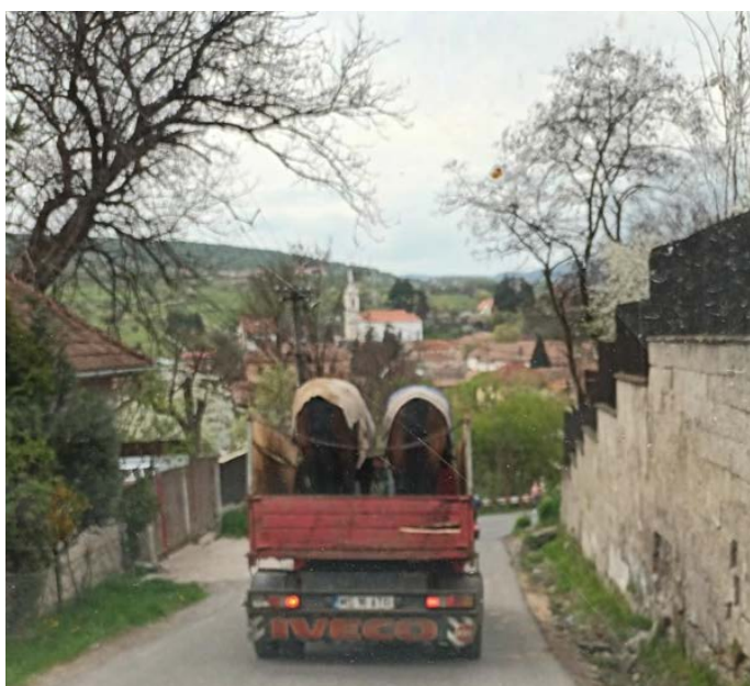
Het moderne vervoer van vee