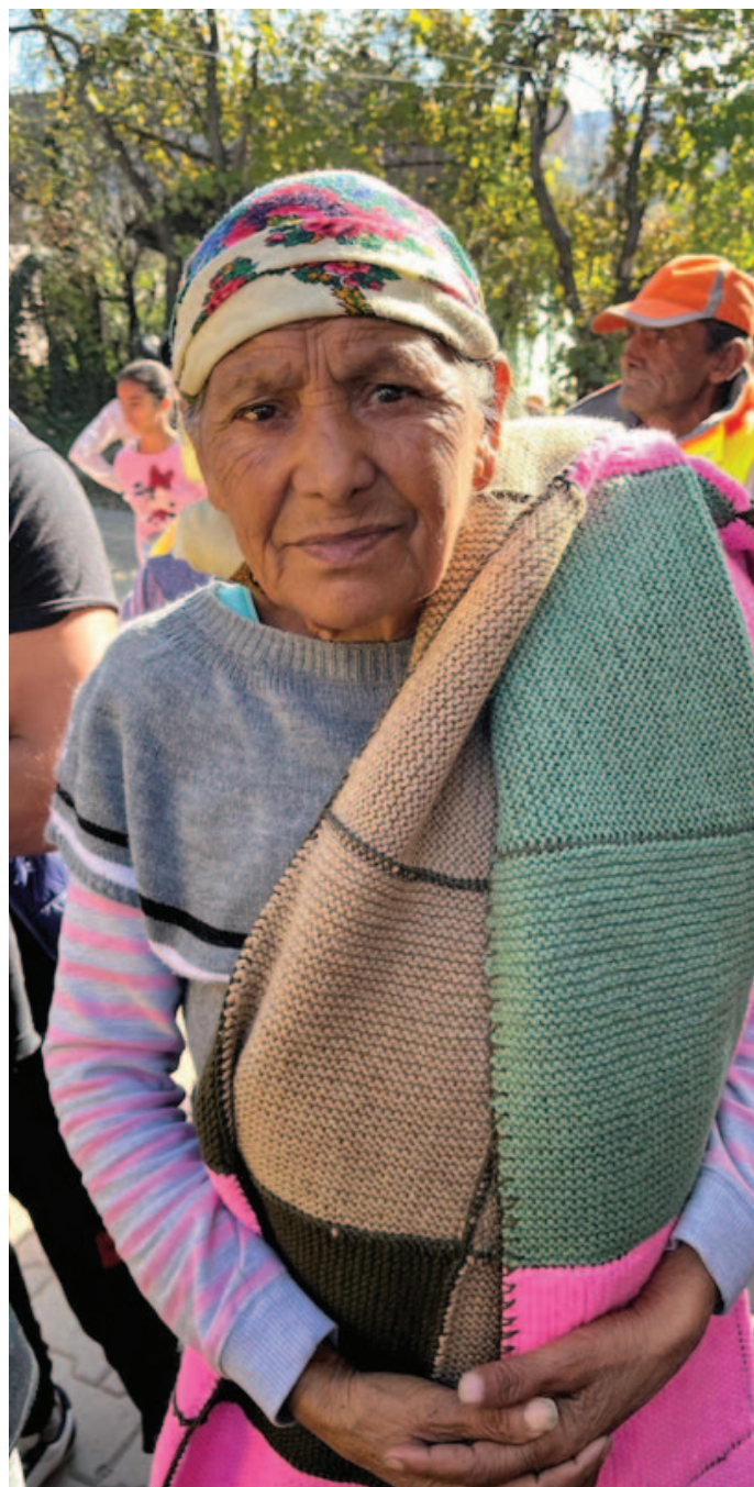
Het wintertransport dat zonder problemen is aangekomen.