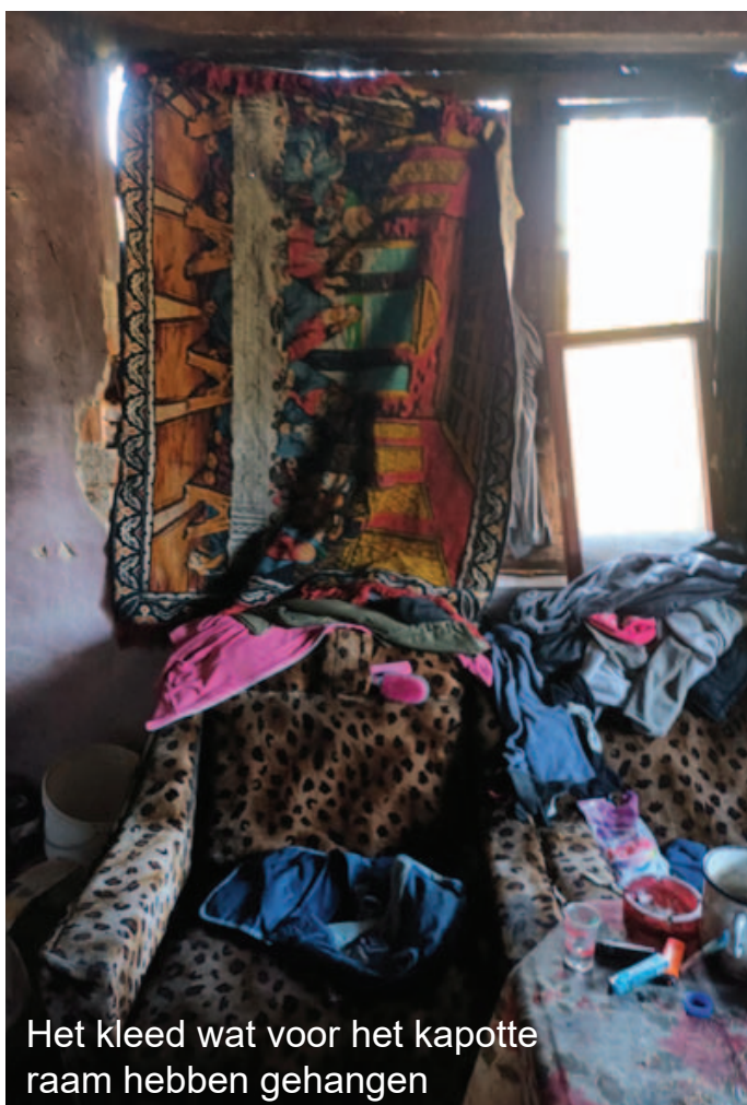
Het kled wat voor het kapotte raam hebben gehangen