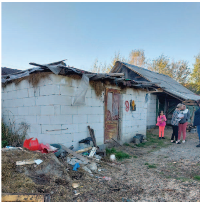
^ Het huis waar Emese, Lajos, Zsolt en Orsolya wonen